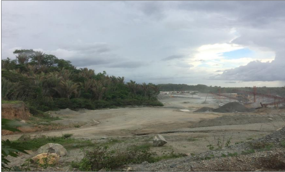
Figura 4: Atividade Mineradora registrada na Granfiorte no município de Bacabeira (MA).