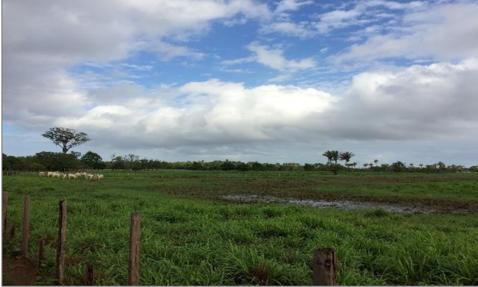
Figura 3: Atividade pecuária extensiva de Bovinocultura no município de Santa Rita (MA).

Bacabeira (MA), Santa Rita (MA) e no Leste de Icatu (MA). Os rebanhos são formados sobretudo por bovinocultura, caprinocultura, piscicultura e avicultura (Figuras 3).