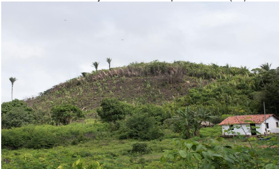
Figura 1: Estágio sucessão da Vegetação posterior à exaustão do solo para a prática da agricultura, nos moldes da “roça no toco” no município de Alcântara (MA).

Na RMGSL, mais de 60% de toda a Cobertura Vegetal original foram substituídas por vegetação secundária em vários estágios de crescimento, isso em razão da retirada do ecossistema florestal para o uso do solo para as atividades agrícolas e pecuária, por exemplo. Essas atividades foram determinantes para exaurir a capacidade do solo para suportar as antigas formações vegetais que ali se encontravam, responsável por desenvolver uma sucessão natural diferente do original, como é o caso bem expressivo no Maranhão e da RMGSL com as Matas de Cocais. (Observa-se na Figura 1).