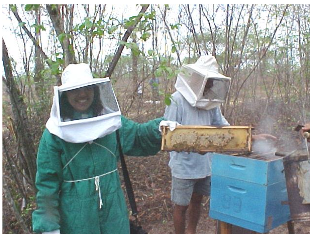
Figura 3: Apicultura (Lagoa dos Cavalos – Russas).

É realizada também pelos agricultores desta comunidade a apicultura (ver Figura 3), uma atividade que vêm possibilitando a geração de trabalho e renda para os agricultores familiares desta comunidade que além do apoio da Cáritas Diocesana, estão envolvidos no projeto Rede Abelha Ceará que articula 23 grupos de agricultores(as) familiares, o que têm facilitado a produção e comercialização de produtos das abelhas, como o Mel de Abelhas – Sabor da Natureza, produzido e processado por esta comunidade, no Apiário Floremel da Associação Comunitária Porfírio Nogueira da Costa.