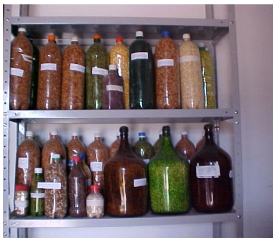
Figura 2: Sementes conservadas em garrafas – Russas.

trocas, o que proporciona também uma maior diversidade destas sementes. Ou seja, o resgate destas sementes contribui para o aumento da biodiversidade e a valorização da identidade da cultura local.