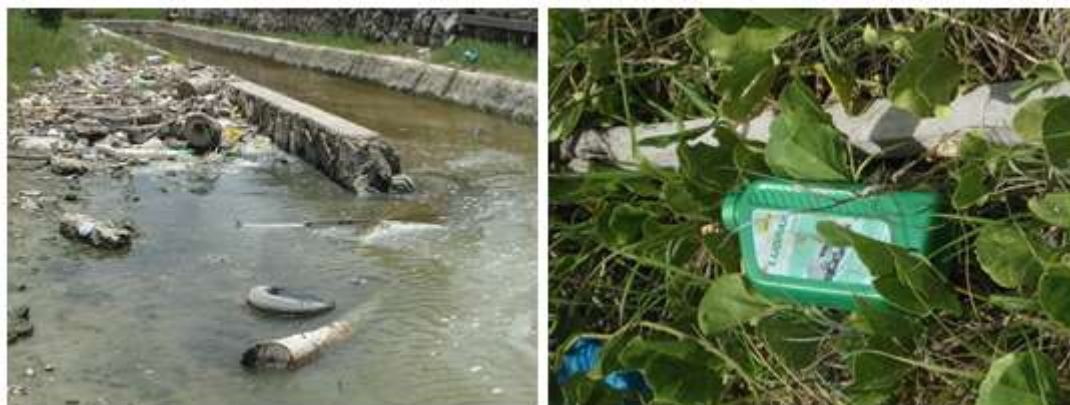
Figura 8: Poluição gerada por resíduos sólidos descartados por visitantes.