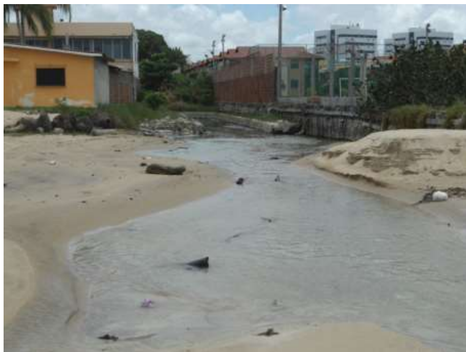
Figura 7: Desembocadura de canal na praia de Maria Farinha, em Paulista.

Outro importante processo degradante que se verifica na área de estudo é a poluição hídrica. Esta se apresenta através do lixo e do despejo de esgoto nas praias visitadas ( Figura 7 ), sem qualquer tipo de tratamento prévio, deixando transparecer mais um dos graves problemas urbanos do Brasil, que seria a ineficácia do processo de coleta do lixo e esgoto, e a pouca consciência ambiental por parte da população.