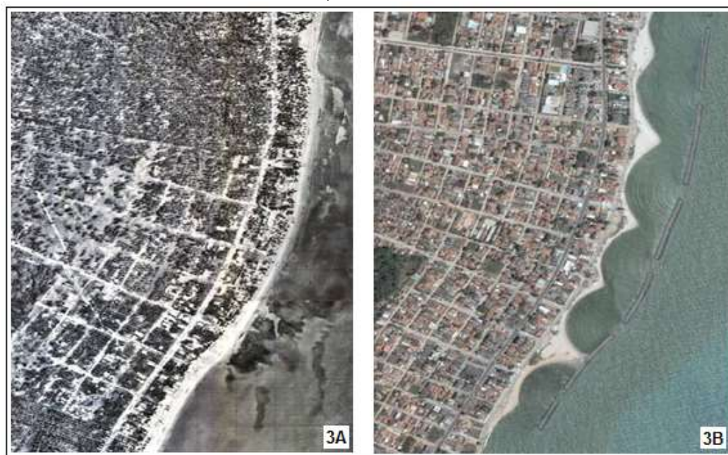
Figura 3: Ação erosiva na orla de Paulista, em decorrência do avanço relativo do nível do mar; 3A: Imagem de 1974, mostrando a extensa faixa de praia nas proximidades da praia de Pau Amarelo; 3B: Imagem de 2010, evidenciando os processos de erosão costeira e a tentativa de minimização de tais processos por meio da construção de uma sequência de quebra-mares.

Com base nas imagens de satélite de trabalhos anteriores e em entrevistas realizadas com os moradores, pescadores, comerciantes e banhistas, foi possível constatar que o processo de avanço do nível do mar no local se intensificou nas últimas décadas ( Figura 3 ).