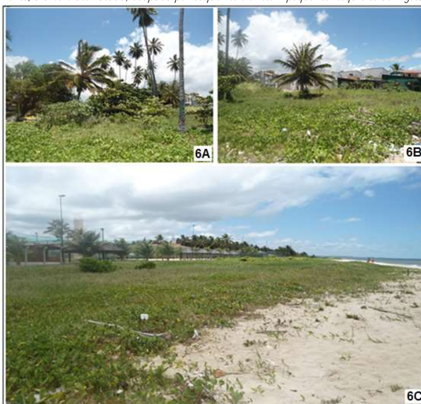
Figura 6: Vegetação existente na área, o que comprova o elevado grau de degradação do ambiente, já que, predominantemente, a área é desmatada, ocupada por coqueiros e existem pequenos resquícios de vegetação de restinga.