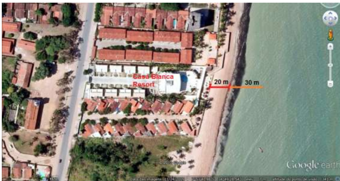
Figura 9: Imagem que retrata onde estaria aproximadamente a linha de praia há 20 anos, na praia de Pau Amarelo.