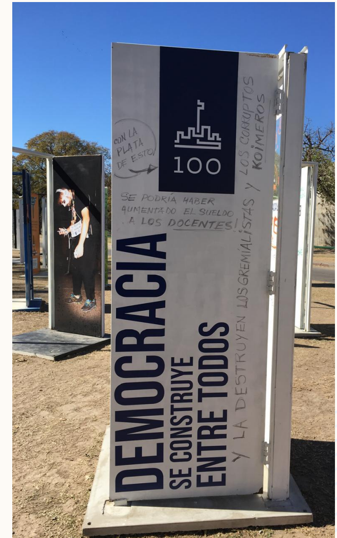
Fotos da/na exposição aberta do centenário de 100 anos da reforma universitária.