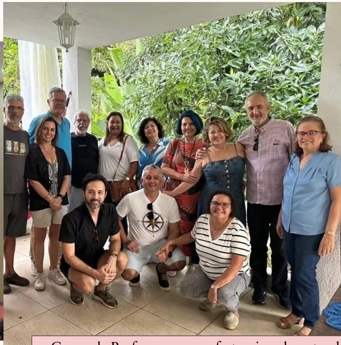
Grupo de Professores se confraternizando antes do início do Seminário Internacional Cidades Médias e Planejamento Urbano. Junho de 2024.