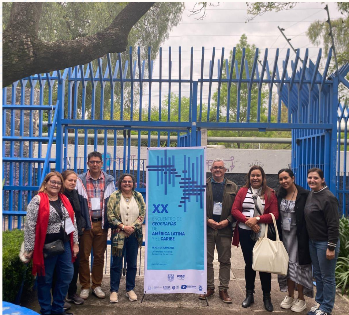
Fotos: Encontros e reencontros no Encontro de Geógrafos da América Latina e Caribe, na Universidade Nacional Autônoma do México-UNAM. Junho de 2025