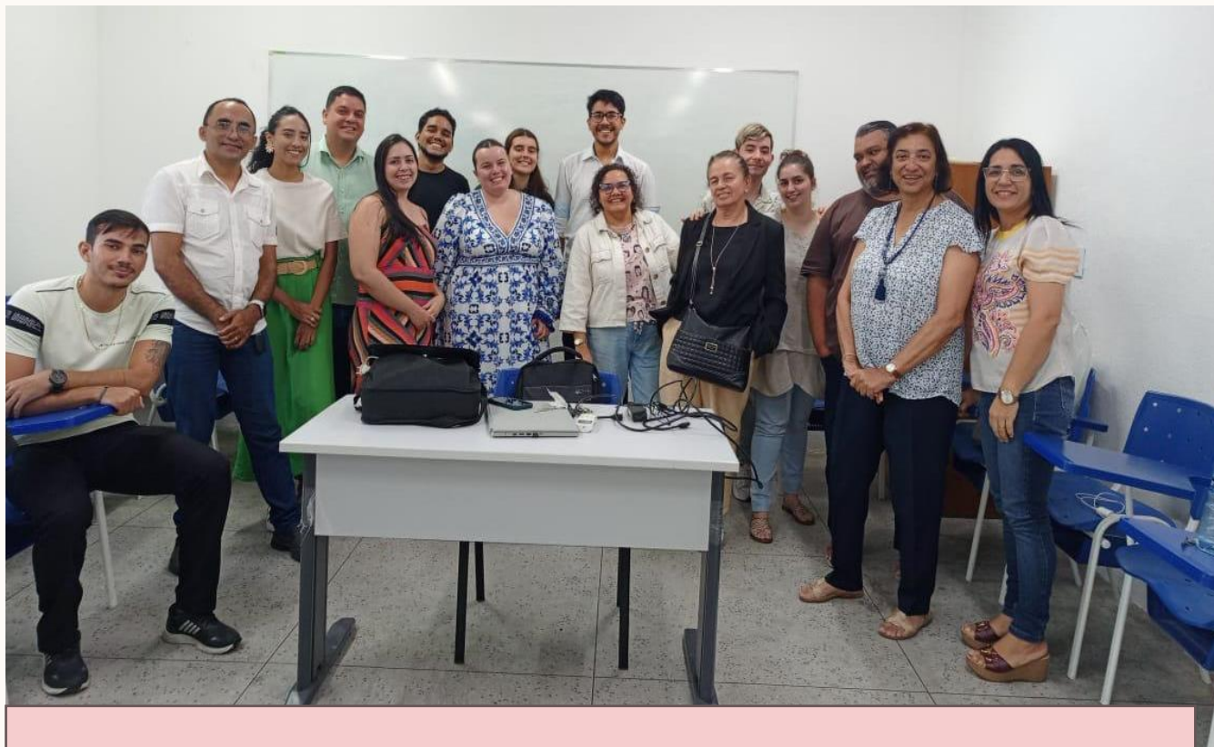
Foto: Disciplina de Teoria e Método. Dialogo entre alunos vindos de Évora e alunos do PropGeo/UVA, em abril de 2025.