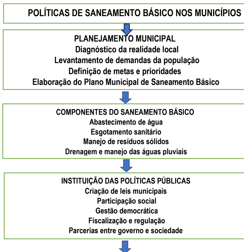
Figura 1: Articulação das políticas de saneamento básico nos municípios.

O mapa conceitual sobre o Planejamento e Instituição de Políticas de Saneamento Básico nos municípios (Figura 1) apresenta os caminhos, políticos e técnicos, que eles precisam desenvolver como governança em seus territórios para atender muitas necessidades relacionadas ao saneamento básico com repercussão na melhoria da qualidade de vida das pessoas.