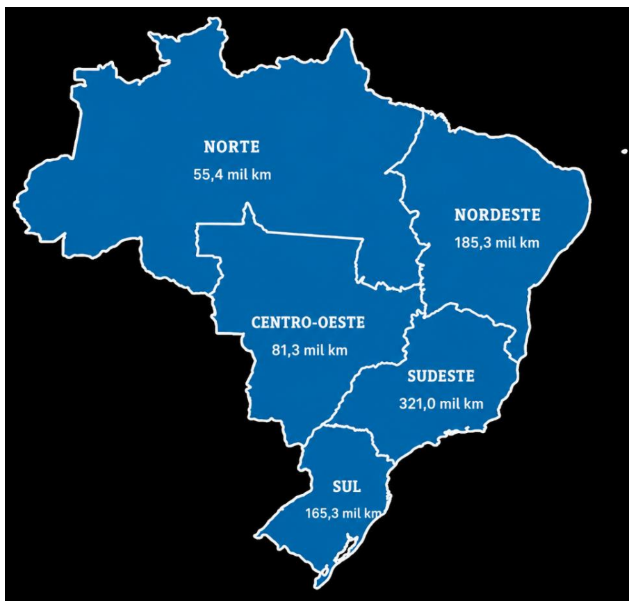
Figura 2: Porcentagem da Extensão das Redes Públicas de Abastecimento de Água no Brasil por Macrorregião.