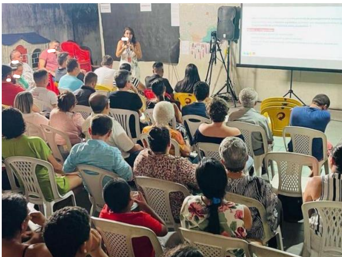
Figura 1: Fórum territorial com participação no bairro São João do Tauape.

Nos fóruns territoriais, representantes da empresa contratada mediaram as reuniões onde as pessoas presentes davam sugestões, tinham direito a fala e apontavam diferenças percebidas no bairro e adjacências. Os seminários temáticos aconteciam no Centro da cidade com temáticas específicas, sobretudo no que diz respeito aos zoneamentos. Esta etapa recebeu diversas críticas pela falta de representatividade em alguns encontros.