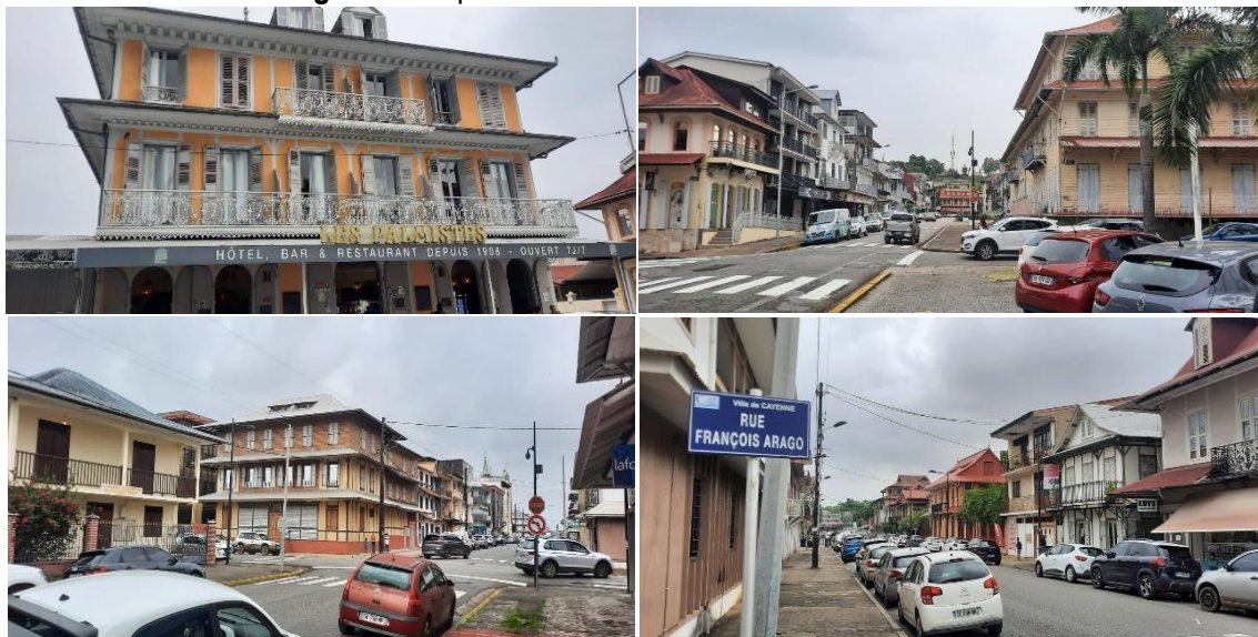
Figura 5: Arquitetura do centro da cidade de Caiena.

No centro de Caiena nos deparamos com a bela e histórica estrutura arquitetônica dos prédios antigos como apresentado a seguir.