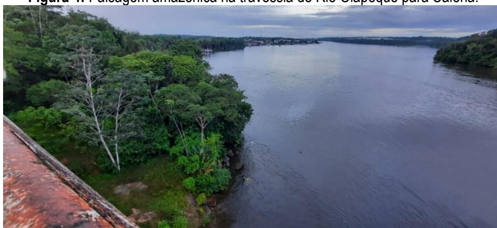
Figura 4: Paisagem amazônica na travessia do Rio Oiapoque para Caiena.

Para chegar à Caiena percorremos cerca de 194 km em aproximadamente 3 horas de viagem, durante a viagem a percepção da paisagem revelou elementos peculiares aos que já costumamos ver na realidade amazônica.