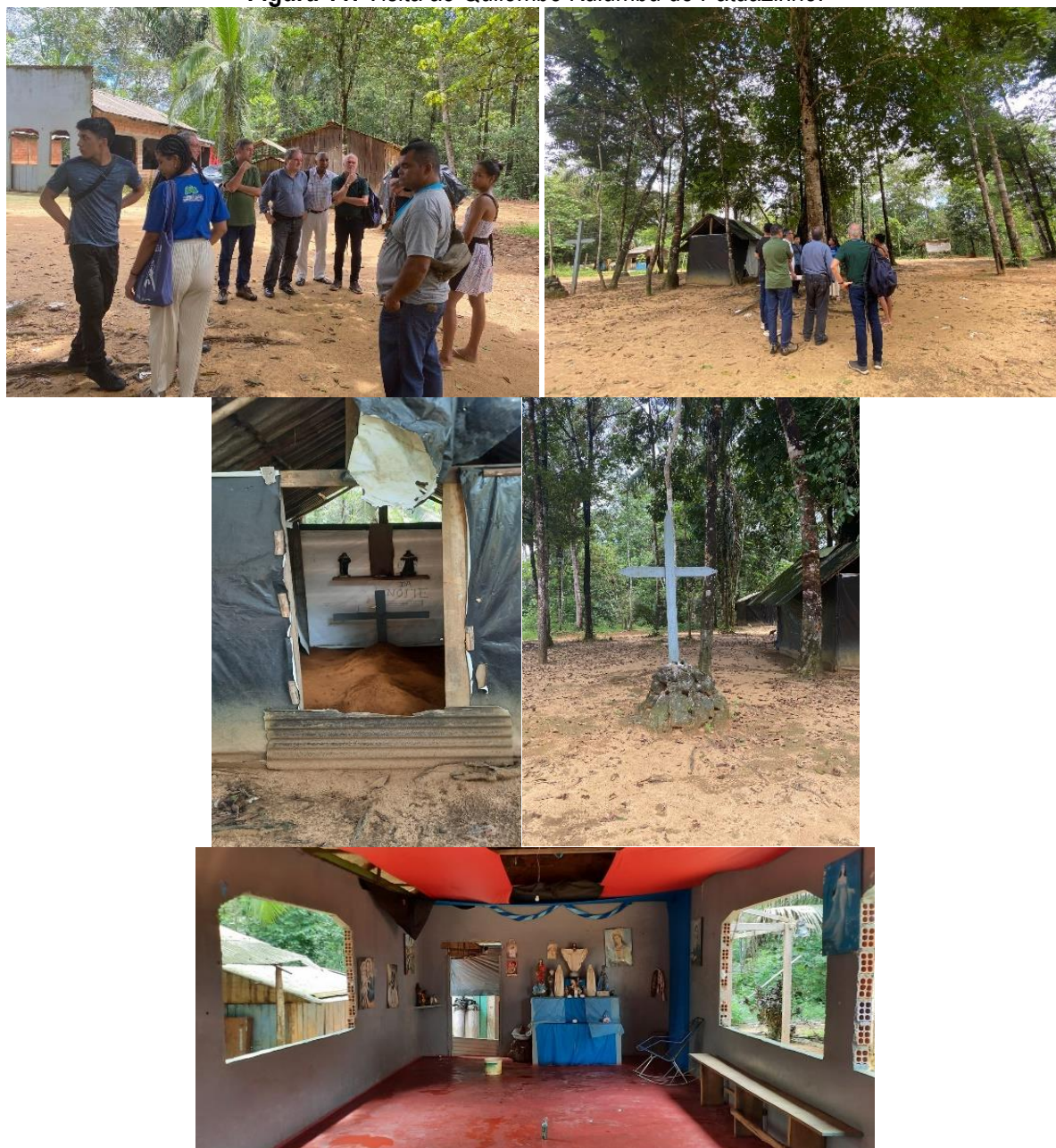
Figura 11: Visita ao Quilombo Kulumbú do Patuazinho.

Chegamos ao Quilombo Kulumbú do Patuazinho, onde exploramos a rica herança cultural e as manifestações religiosas de matriz africana, onde a comunidade utiliza árvores caídas para a extração de madeira e pratica o manejo sustentável de óleos essenciais e frutas. A liderança comunitária é fundamental para a organização e o desenvolvimento local, preservando as tradições e promovendo a sustentabilidade.