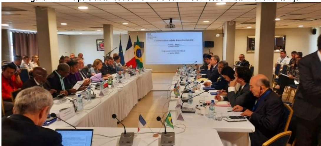
Figura 7: Principais autoridades no início da XII Comissão Mista Transfronteiriça.