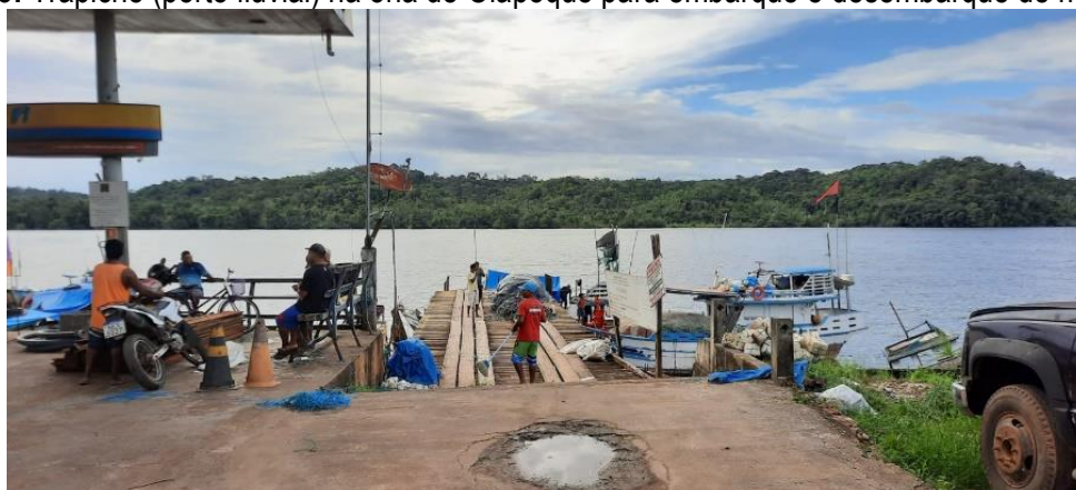
Figura 13: Trapiche (porto fluvial) na orla de Oiapoque para embarque e desembarque de mercadoria.