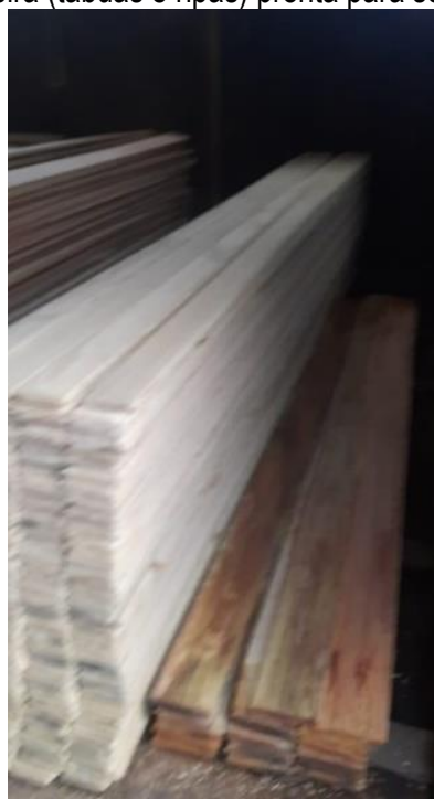
Figura 14: Madeira (tábuas e ripas) pronta para ser comercializada.