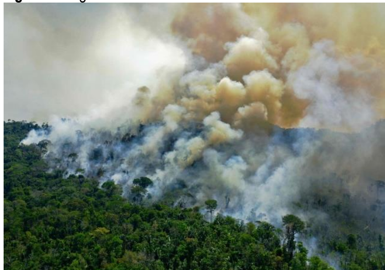
Figura 1: Fogo consome a floresta amazônica no Pará em 2024.