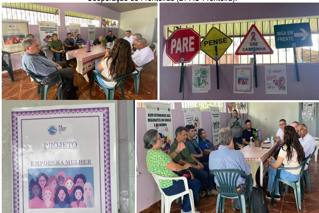
Figura 9: Visita dos pesquisadores na Associação de Desenvolvimento Prevenção Acompanhamento e Cooperação de Fronteiras (DPAC-Fronteira).