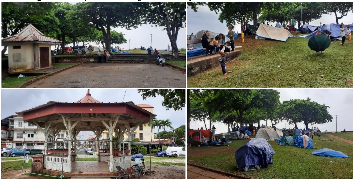
Figura 6: Acampamento de imigrantes na Praça Des Armandiers no centro de Caiena.

Entretanto, o que vai além da beleza arquitetônica se contrasta com a realidade observada no centro da cidade. Uma praça tomada por imigrantes venezuelanos, sírios e libaneses remonta aos fluxos migratórios recentes (Figura 6), resultado de crises políticas, econômicas e humanitárias em seus países de origem. Essas populações buscam refúgio em Caiena, atraídas tanto pela segurança quanto pelas oportunidades oferecidas pela cidade que apesar de sua infraestrutura bem estabelecida, enfrenta o desafio de integrar esse crescente número de imigrantes.