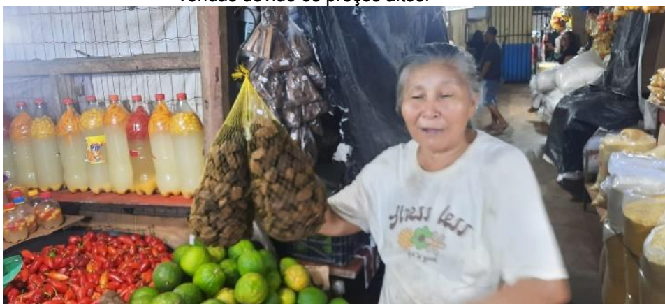
Figura 12: Feirante no mercado de Oiapoque relatando sobre a praga da mandioca e a baixa nas vendas devido os preços altos.

elevando os preços (Saca de 25kg R$ 240,00) e forçando os comerciantes a buscar produtos em outros mercados. A escassez e a alta demanda têm impactado negativamente o comércio deste produto.