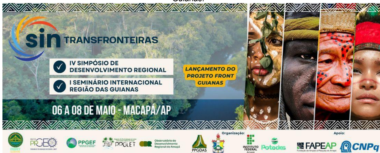
Figura 8: Material de divulgação do Sintransfronteiras e do I Seminário Internacional Região das Guianas.

A equipe de pesquisadores do PFG percorreu o primeiro par de cidades gêmeas, Saint Georges de l'Oyapock (GF/FR) e Oiapoque (BR), em maio de 2024, mas antes de iniciar esta incursão o Projeto Front-Guianas foi lançado em Macapá, juntamente com um Seminário denominado de Sintransfronteiras (IV Seminário de Desenvolvimento Regional), planejado e organizado em conjunto com a equipe da PFG e pelo Programa de Pós-Graduação Desenvolvimento da Amazônia Sustentável (PPGDAS/Unifap), além deste evento, o lançamento foi nomeado de I Seminário Internacional Região das Guianas (Figura X), realizado no Museu Sacaca e na Universidade Federal do Amapá, no período de 06 a 08 de maio de 2024.