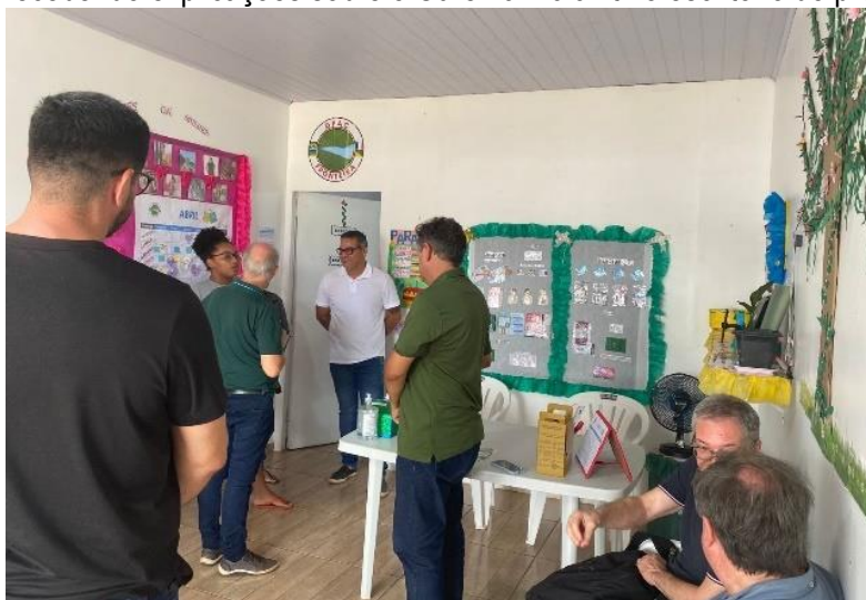
Figura 10: Recebendo explicações sobre o Curema Malakit no escritório do projeto.

Conhecemos o projeto Curema Malakit, uma iniciativa inovadora da DPAC. Um projeto voltado para a eliminação da malária entre as pessoas envolvidas na garimpagem de ouro que trabalham e se deslocam no Escudo das Guianas. O projeto busca melhorar a saúde pública na fronteira, oferecendo cuidados e recursos essenciais para a população local, especialmente nas áreas afetadas pela mineração ilegal.