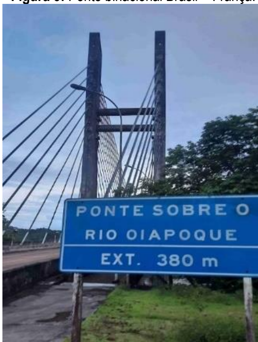
Figura 3: Ponte binacional Brasil – França.